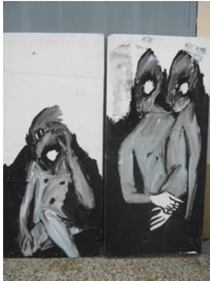
2004 Sans titre tableau composé technique mixte sur bois 0,98 ml x 1,02 par 2 panneaux