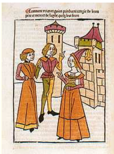
Illustration du livre de Mélusine, 1478 .

Mélusine est une femme, ça on en est sûr à 90,2 %, une femme légèrement légendaire des contes populaires de rien, une femme d'âge moyen du Moyen Âge. Très ancienne, elle a la coupe de l'époque, comme si la tempête s'était engouffrée jusque sous son crâne. Protectrice d'une divinité svelte, la fontaine de la soif à la langue pendante, elle s'est d'abord appelée Préfontaine, avant de rencontrer Bécassine, ma cousine, qui la prénomma Mélusine, pour une sombre histoire, non mais je vous demande un peu, une ridicule histoire de rime à deux balles.